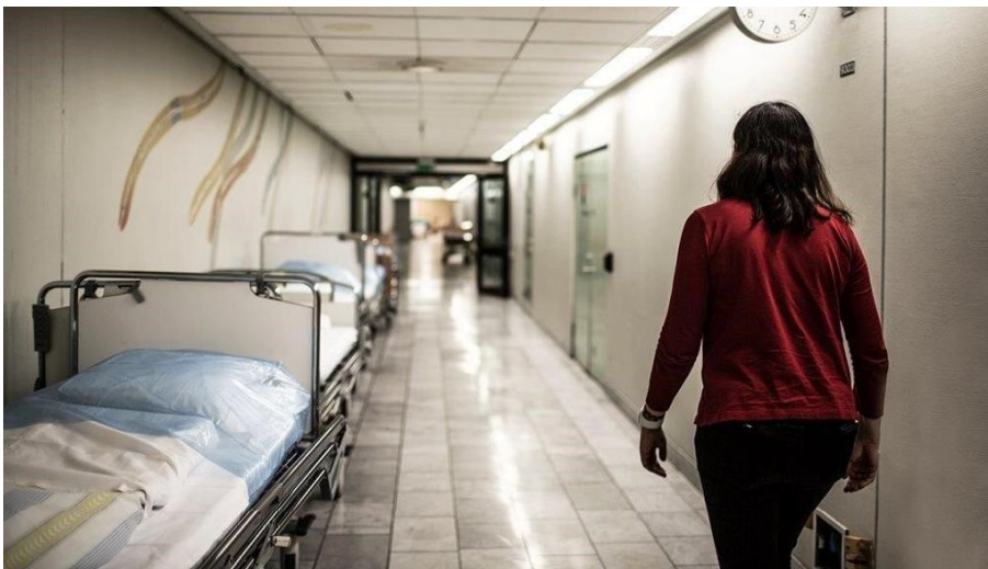
125 000 kvadratmeter med sykehuskorridorer, pasientrom og klinikker. Sentralblokken på Haukeland er Bergens største bygning.

– Med WiFi Tale slipper vi alt dette, forteller Radulović. – Alt du trenger er din egen mobil, og tjenesten koster ikke noe ekstra for Telenor-kunder. I tillegg kan du med trådløse øretelefoner bruke hendene fritt samtidig som du snakker. Dette kan være veldig nyttig for leger, sykepleiere og teknisk personell.